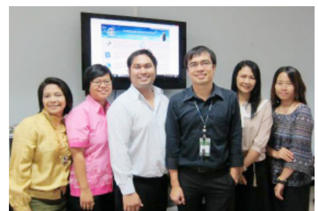
ทีมงานผู้จัดทำเว็บไซต์

ศึกษา (Continuing Education in Medical Education) รวมหลักสูตรและเว็บไซต์ของสถาบันที่มีหลักสูตรต่อเนื่องด้านแพทยศาสตรศึกษา